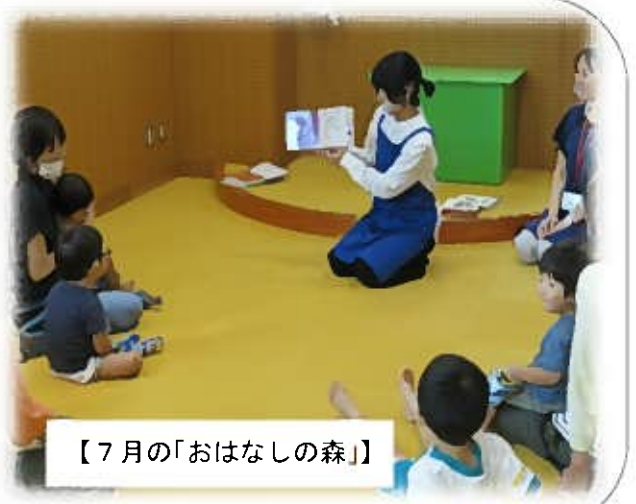
【7月の「おはなしの森」】

当館スタッフが、手遊びや選りすぐりの絵本の読み聞かせを行いますので、興味のある方は、1階カウンターまたはお電話(52-0244)にてお問い合わせください。